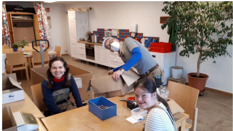
Mit Freude und Wiederholung miteinander alles schön hinbekommen.